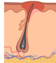
Le poil est coincé alors qu'il tente de s'extraire de sous la surface de la peau.