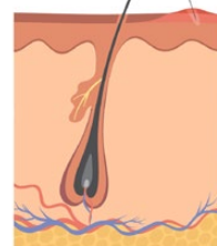
Le poil a repoussé sur lui-même et s'est replié sous la surface de la peau.