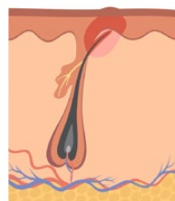
La pousse du poil a été bloquée et ce dernier a commencé à pousser sur le côté.